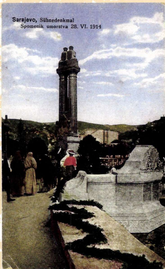
▪ A szarajevói emlékmű (képeslap)