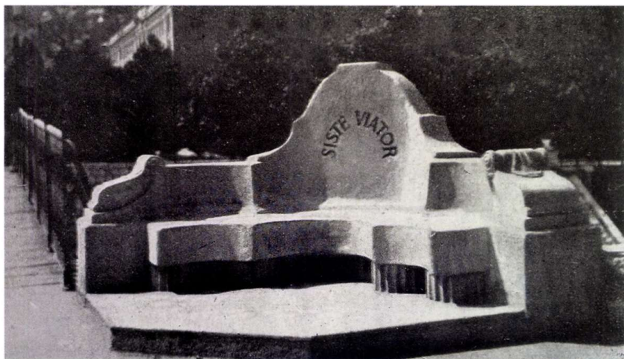
4. kép ■ Az emlékművel szembeni emlékpád eredeti állapota

A Miljačka folyó partján emelt alkotást 1917. június 29-én, a merénylet harmadik évfordulóját követő napon avatták fel, ünnepélyes formában. Az uralkodócsaládot Frigyes főherceg, tábornagy képviselte. 17 Bory Jenő az alkotásért 1917. júliusban az Osztrák Császári Ferenc József Rend lovagkeresztje hadidíszítménnyel kitüntetést kapta. 18