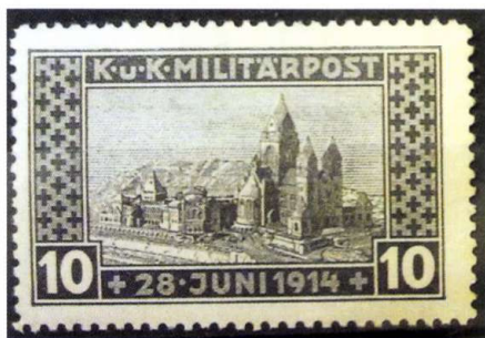
8. kép ■ Az emléktemplom és a Sophia-neum terve bélyegen

Bory Jenő szarajevói megvalósult, majd lebontott alkotásai, továbbá nagyszabású építési tervei, valamint a terveket megörökítő bélyeg érdekes és értékes adalékok a magyar történelem és művészettörténet számára.