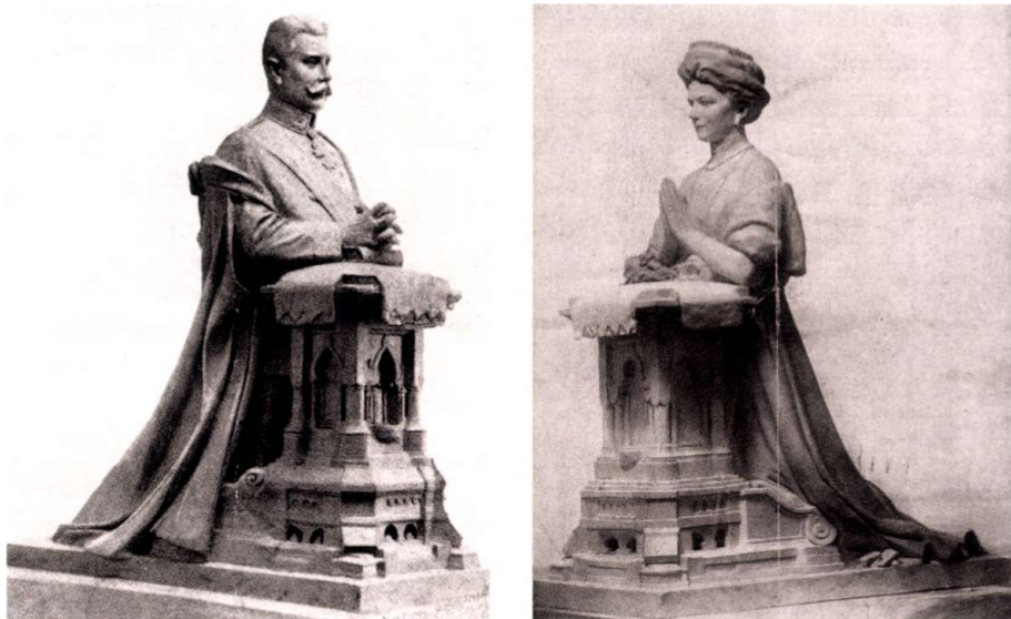
7. kép ■ Ferenc Ferdinánd és Zsófia szobrai az emléktemplom számára

építőanyagot. A templom alapozási munkái olyan ütemben haladtak, hogy 1917-ben Bory megkezdte a belső szobordíszek mintázását is. Elsőként Ferenc Ferdinánd, illetve Zsófia szobrát készítette el. Mindkét alkotás imázsamolyon térdelve és imádkozva örökítette meg a főherceget és feleségét. A két szobor márványba faragva a templom főoltára közelében került volna elhelyezésre. Az alkotások fényképét 1917 tavaszán A Társaság folyóirat közölte. 26