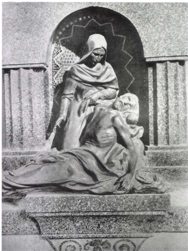
3. kép ■ A Pietà-szobor