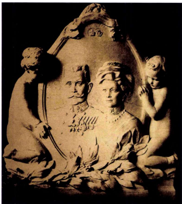
2. kép ■ Ferenc Ferdinánd és Zsófia portréjának mintája