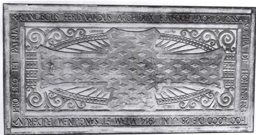
5. kép ■ A merénylet helyszínén az úttestbe süllyesztett acéллеmez

úgy tudják, hogy azokat a mai kelet-boszniai szerb autonóm területhez tartozó Trebinjébe vitték. 22 Az úttestbe épített, majd onnan kiszedett acéllap további sorsa nem ismert.